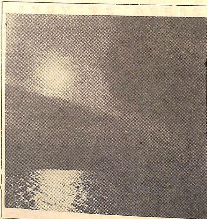
Из коллекции НФС «Образ». Два пейзажа. Фото В. КУКУШКИНА.

Пунши Холодные или горячие напитки. Готовят на основе чая, а иногда и молока. В них мо-